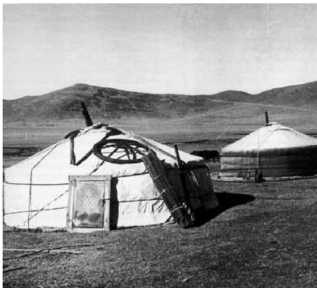
Jurte della Mongolia, le tende tipiche delle popolazioni nomadi

Canto Gregoriano. Fa tappa alle 21.15 nell'Abbazia di San Benedetto a Seregno il concerto dedicato al canto gregoriano nella devozione mariana. La Schola Gregoriana Mediolanensis, diretta da Giovan-