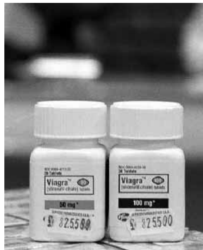
Confezioni di «Viagra» esposte in una farmacia di San Marino.