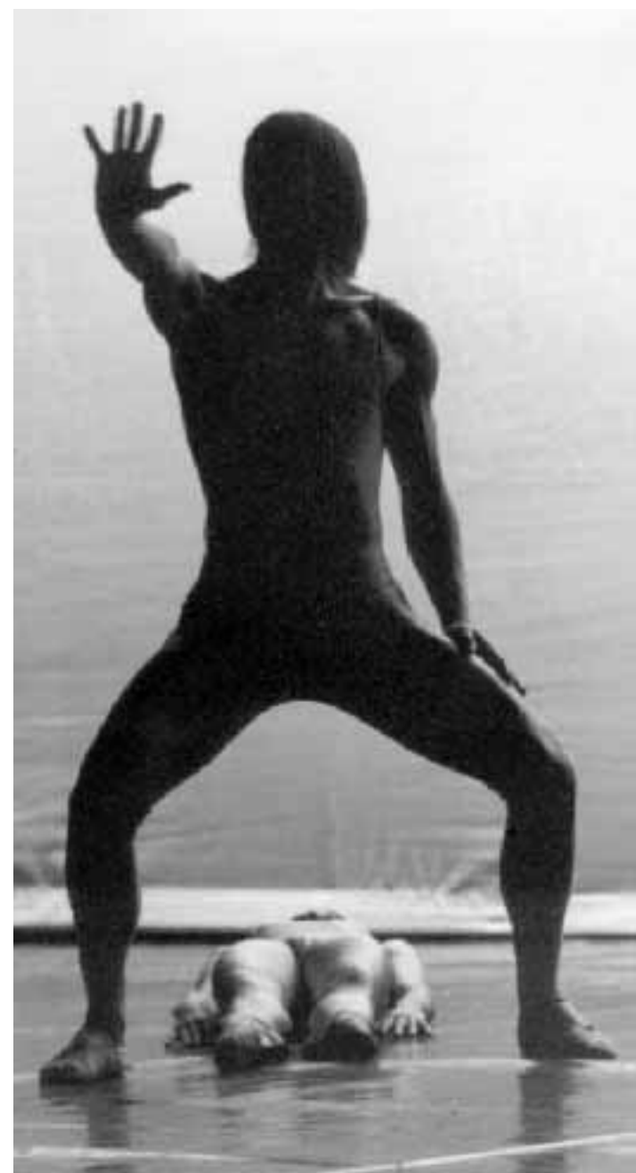
Una delle foto di Angelo Redaelli

Metropoli è spettacolo, cultura, intrattenimento, ma non solo questo. Da quando è nata la rassegna si propone innanzitutto di far conoscere le bellezze nascoste della nostra provincia, riaprendo al pubblico ville e castelli, palazzi, giardini che normalmente nascondono i loro tesori a sguardi indiscreti, ma in occasione delle manifestazioni si offrono al pubblico. Basta citare Villa Arconati o i giochi d'acqua di Villa Borromeo Visconti Litta a Lainate. Per saperne di più è bene dotarsi di un agile strumento messo a punto anche quest'anno dalla Provincia di Milano, il volume «Metropoli» reperibile in distribuzione gratuita presso l'Apt di Milano in via Marconi 1. Si tratta di 216 pagine di informazione dettagliata sui Poli culturali e sui Comuni promotori delle iniziative, nonché sui programmi (orari, prezzi, schede degli spettacoli), informazioni storiche e artistiche sui beni ambientali e culturali dei luoghi che ospitano le manifestazioni, nonché indicazioni stradali, dei parcheggi, degli itinerari ciclabili e i numeri telefonici utili. Un indispensabile vademecum per distreggiarsi tra le centinaia di offerte della rassegna.