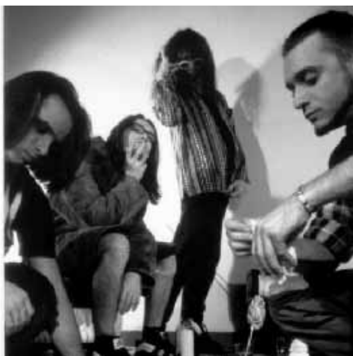
Il gruppo Scarecrow all'Indian's Saloon