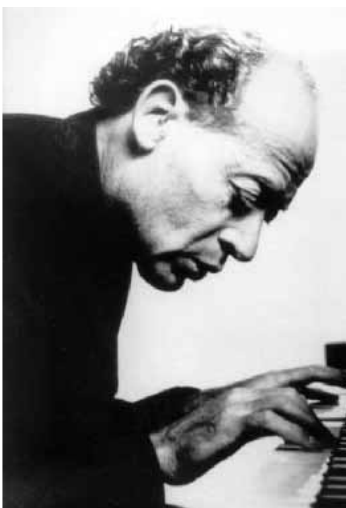
David Helfgott in concerto al Teatro Lirico