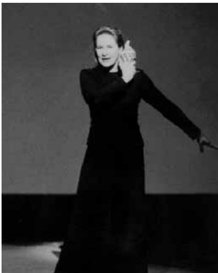
Dominique Sanda in «La donna del mare»