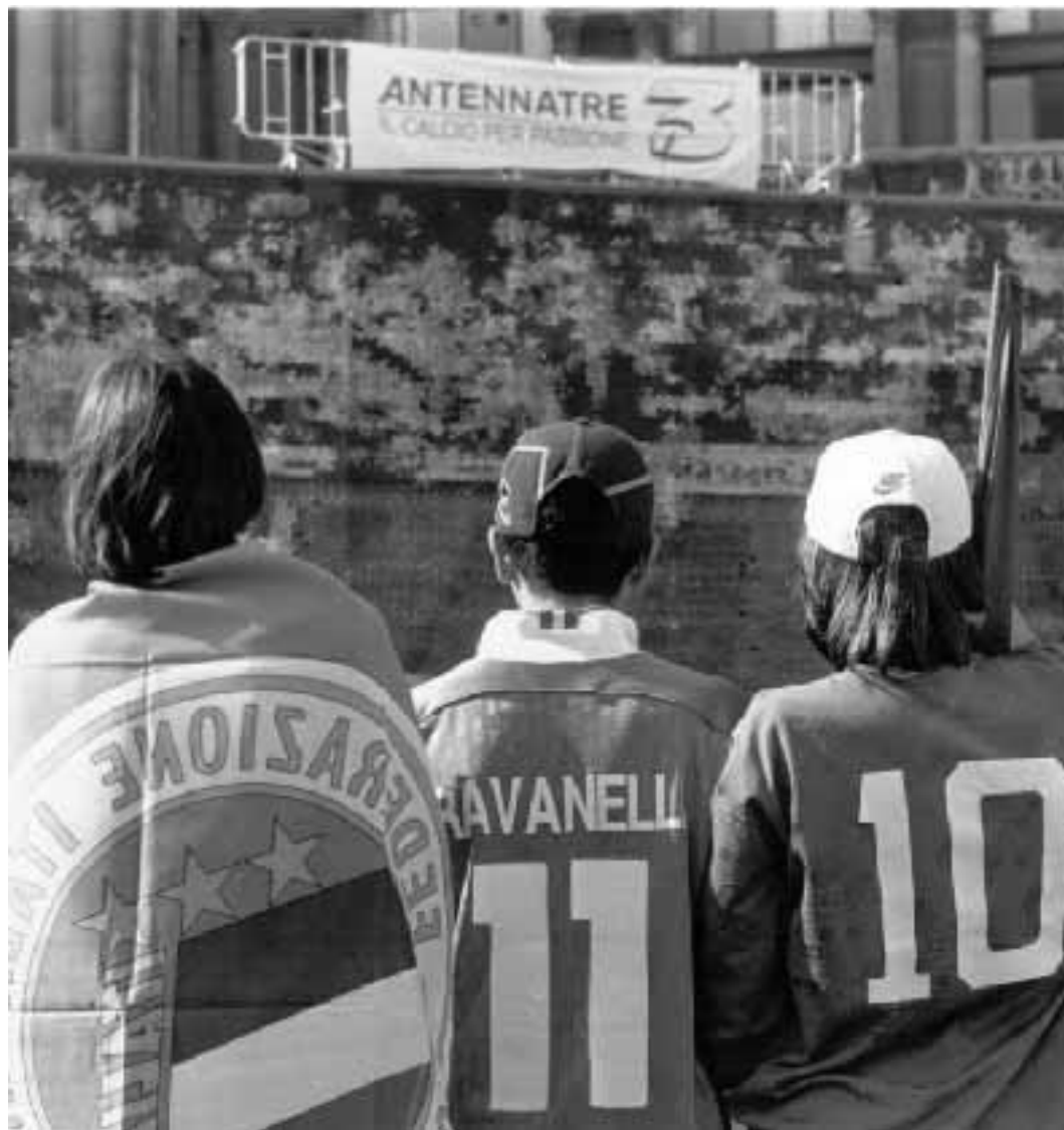
Alcuni tifosi della Nazionale davanti al maxischermo in piazza Duomo durante gli Europei del '96