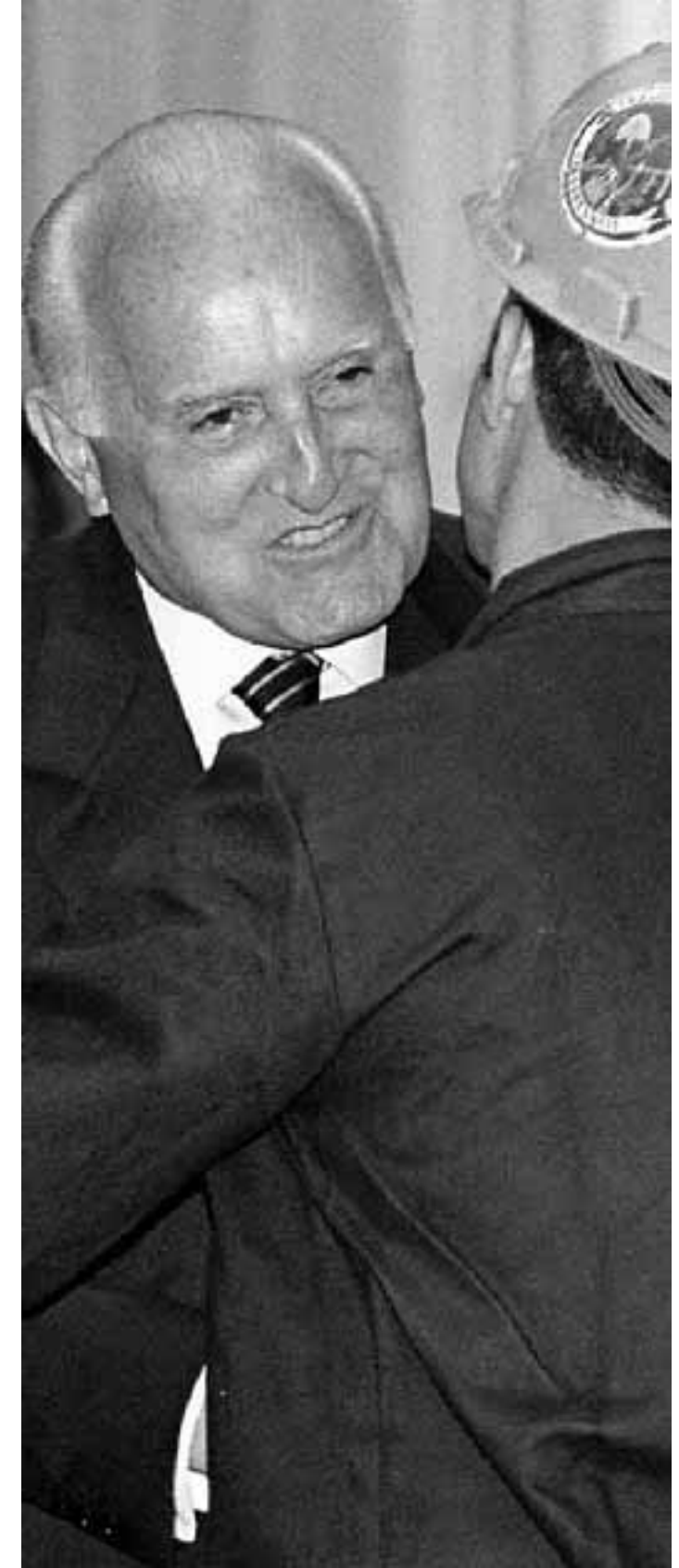
Scalfaro abbraccia un minatore del Carbosulcis Solinas/As

po variabili. I temi delle riforme e del lavoro rischiano così di rimanere congelati. Messaggio bilama.