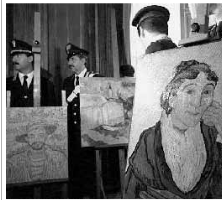
Poliziotti e carabinieri con i tre quadri ritrovati