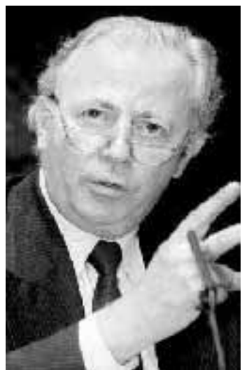
Il presidente della Commissione europea Jacques Santer

gna trovare un equilibrio ottimale fra il calo del deficit e la riduzione dei prelievi obbligatori». In Francia «la crescita comincia solo adesso», va sostenuta per farla durare 5-6 anni. Solo dopo un periodo così lungo i deficit spariranno. L'Europa deve approfittare adesso dell'inflazione ai minimi storici, con la crisi asiatica che ha sgonfiato i prezzi di molte materie prime. Se non ora, quando? Ci sono ragioni molto «francesi» che sostengono lo stop di DSK: dopo due anni di espansione, l'economia d'Oltralpe ricorda un aeroplano con uno dei due reattori in panne. Jospin è ossessionato dalla disoccupazione - come molti altri governi a cominciare dal nostro - ed è anche ossessionato dalla necessità di riequilibrare la barra del timone: finora la crescita è stata trainata dai consumi tassando le imprese (secondo