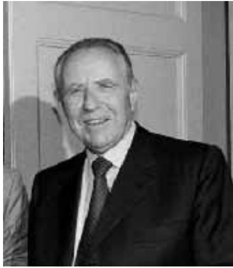
Il ministro del Tesoro Carlo Azeglio Ciampi

Se Visco se l'è presa anche con Fazio che tiene inchiodato il tasso di sconto, Ciampi - che non ha inseguito il collega delle finanze nella polemica sui tassi - se la prende con le imprese: «Quando la forte domanda di investimenti si traduce soprattutto in importazioni di beni di investimento la cosa mi preoccupa perché vuol dire che le imprese non hanno accresciuto in tempo la propria capacità produttiva».