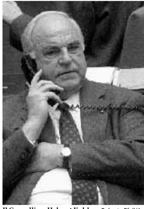
Il Cancelliere Helmut Kohl

Undici settimane sono poche, ma il tempo sta lavorando per lui, sostiene il cancelliere: basteranno per mostrare i frutti di quanto ha seminato. Ha fiducia nel fattore tempo, Kohl, e nell'economia che in questa estate dà segni sensibili di ripresa. Nel '98 il prodotto interno lordo avrà una crescita vicina al 3 per cento, conferma il cancelliere. In poche settimane - tra maggio e giugno scorsi - la disoccupazione è diminuita di quasi mezzo punto. Se si guarda un po' più indietro si scopre che in quattro mesi si sono registrati 740.000 disoccupati in meno. Un dato che tende a migliorare, secondo Kohl: per la fine dell'anno, la Germania vedrà scendere l'esercito dei senza lavoro al di sotto della soglia dei quattro milioni (attualmente sono 4,075 milioni). Fattore incoraggiante, per il cancelliere, il