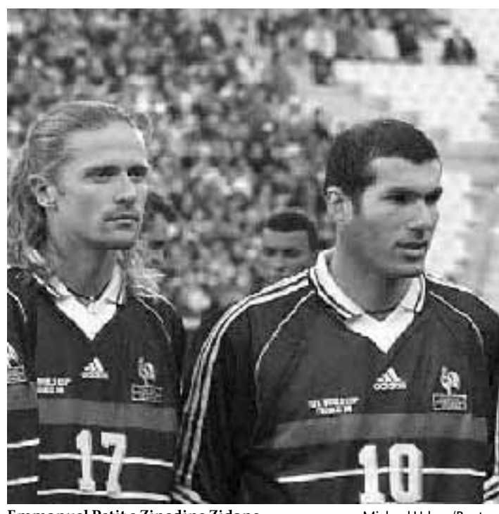
Emmanuel Petit e Zinedine Zidane

Da Ronaldo a Owen, da Petit a Del Piero, sono i nuovi «primi della classe» che fanno felici sponsor e tifosi. Ma c'è chi rimpiange il «cattivo» Maradona