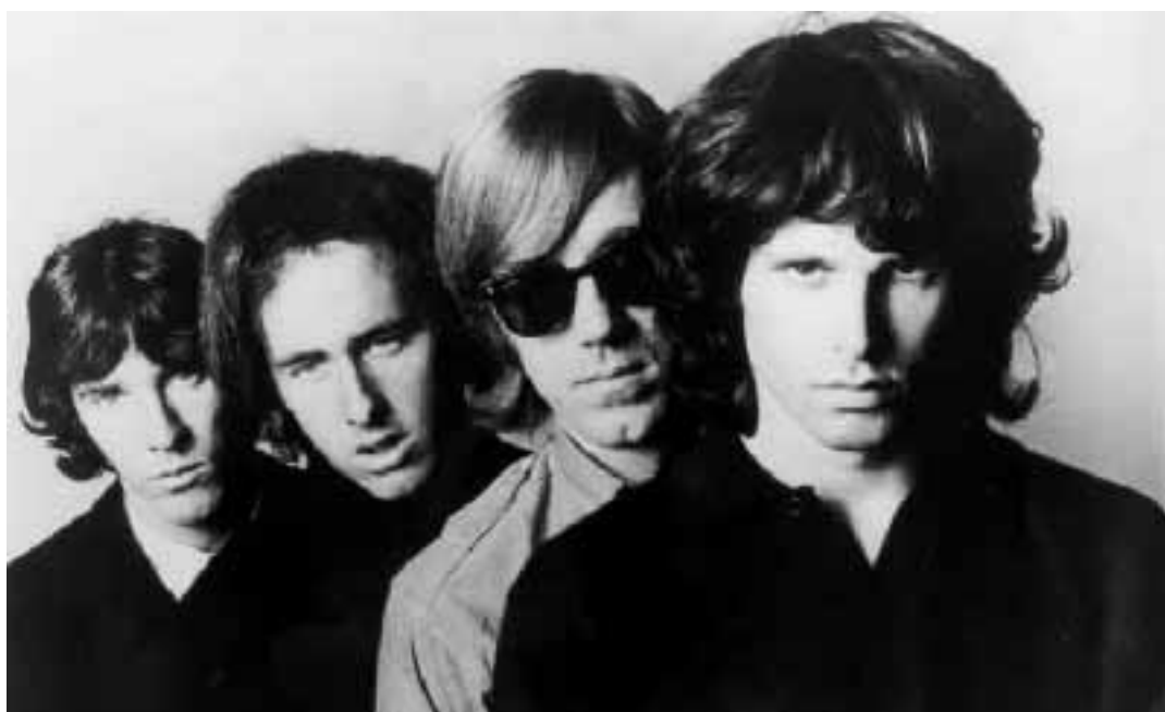
I veri Doors, con Jim Morrison, in una foto dell'epoca. Il chitarrista Krieger è il secondo da sinistra

Dopo Manzarek, anche John Densmore ha dato forfait. Rimane solo Robby Krieger