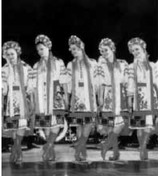
Nelle foto, da sinistra a destra: il complesso folkloristico dell'Armata Rossa; l'Aterballetto in scena e il concerto in omaggio ai Beatles al Castello

DANZA: apre la rassegna l'Aterballetto, (sabato al Cortile del-