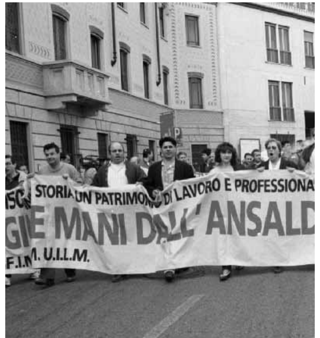
Rossella Dallo Una manifestazione degli operai Ansaldo; in basso, i lavoratori Postalmarket a Lambrate

ne (il 68% pari a 29.200 persone) è stato assunto con contratti atipici: il 48% a tempo determinato, il 20% part-time, e sempre in grandissima maggioranza nei servizi (62%). Inoltre aumentano, tra i lavoratori autonomi, quelli «parasubordinati», cioè a ritenuta di acconto: si stima che siano oltre 200 mila unità, di cui 123 mila iscritti all'Inps pari al 12% del totale nazionale. Quanto alle nuove forme di intermediazione alternative al Collocamento, delle 30 agenzie di lavoro interinale (anche detto «in affitto») autorizzate a livello nazionale, 22 sono presenti a Milano. Operative da pochi mesi, hanno già collocato nell'industria manifatturiera, nel terziario e nei trasporti ben 4000 dei 13 mila avviati in tutt'Italia. Duecento di questi, di cui il 70% a Milano, poi sono stati assunti in pianta stabile dalle stesse aziende che li avevano richiesti temporaneamente.