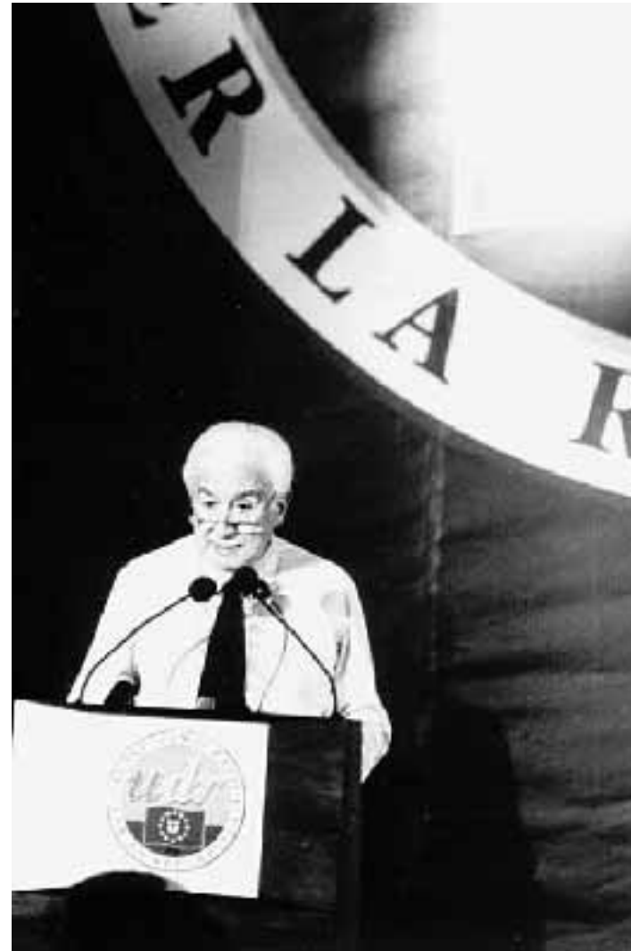
Il senatore Francesco Cossiga

Ma non è stato questo l'unico tema: il leader popolare ad esempio ha «spiegato» la sua intervista si come una pressione verso Bertinotti, ma anche come dettata dalla convinzione che alla fine i voti di Cossiga potrebbero arrivare in ogni caso alla Finanziaria, proprio per la necessità dell'«picconatore» a tenersi distante dall'opposizione del Polo.