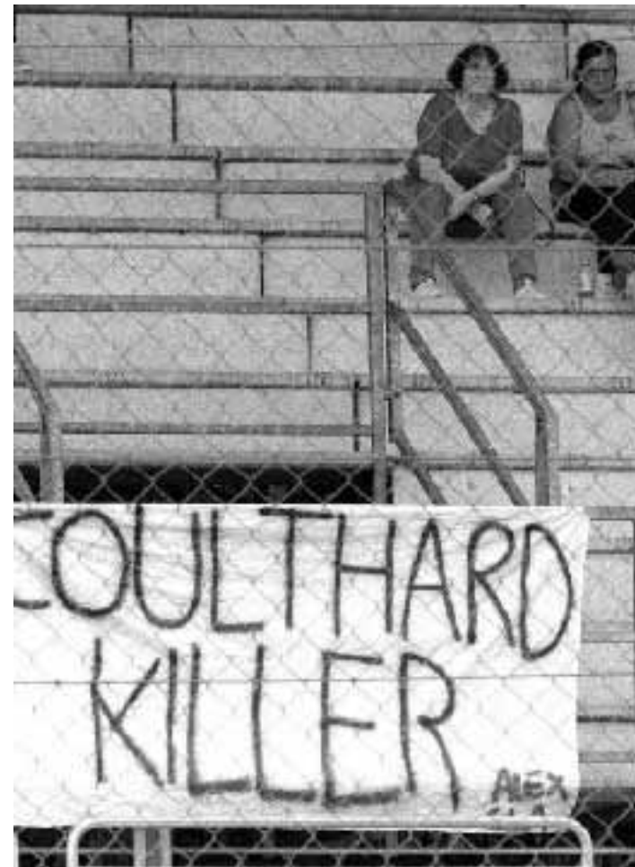
Uno striscione contro Coulthard, apparso ieri a Monza