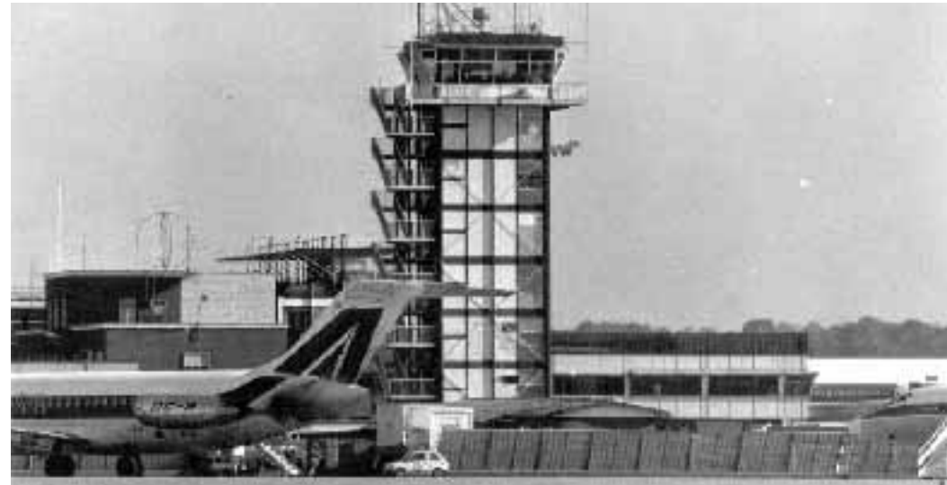
Lavori per l'aeroporto di Malpensa 2000 De Bellis

Una giornata frenetica, quella di ieri, con un susseguirsi ininterrotto di voci e prese di posizione, mentre i tecnici italiani ad europei continuavano a trattare via telefono. Voci, innanzitutto da Bruxelles: «La Commissione Ue non è troppo ottimista a trattare via telefono. Voci, innanzitutto da Bruxelles: «La Commissione Ue non è troppo ottimista a trattare via telefono. Voci, innanzitutto da Bruxelles: «La Commissione Ue non è troppo ottimista a trattare via telefono.»