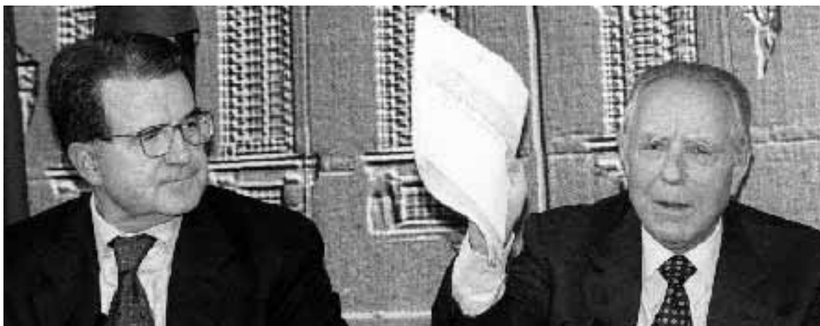
Romano Prodi e Carlo Azeglio Ciampi mentre presentano la nuova Finanziaria

Lo spettro che avanza è quanto meno l'esercizio provvisorio per il bilancio statale, che blocca tutti i provvedimenti in corso. Secondo il ministro della Funzione Pubblica Franco Bassanini è «ormai troppo difficile» evitarlo, ci