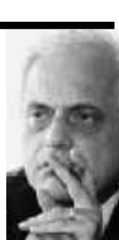
ADDIO AL 60% Se la manovra non passa entro la fine dell'anno sfumano tutti i rimborsi

Alla sorte della finanziaria sono legati anche la cancellazione del bollo sul passaporto e la «carbon tax» in base alla quale sarebbe aumentato il prezzo della benzina. È a rischio il provvedimento sui mutui casa, ora all'esame