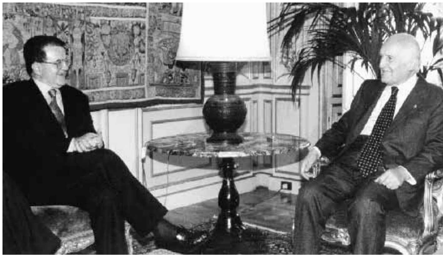
Il presidente della Repubblica Oscar Luigi Scalfaro, durante l'incontro con il presidente del Consiglio Romano Prodi

Solo lunedì - quando le delegazioni dei gruppi parlamentari cominceranno a salire al Colle - è stata annullata una, pur bre-