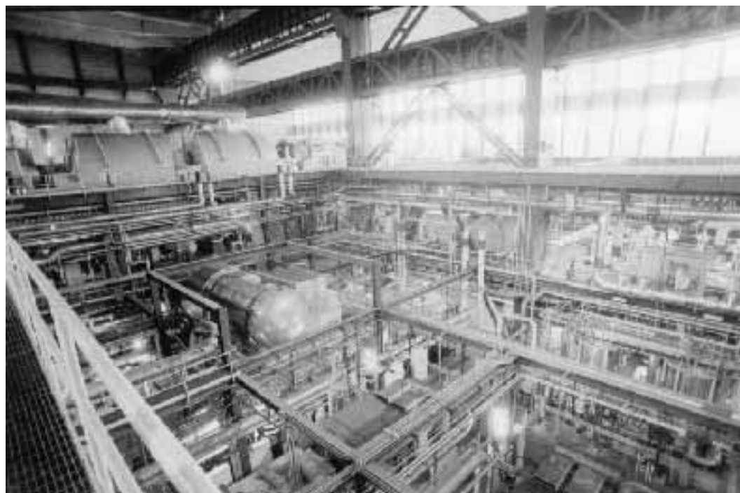
L'interno della centrale elettrica di Civitavecchia; a lato Pierluigi Bersani

clienti: 30% già l'anno prossimo e 35% nel 2000. Ciò significa che entro il 2003 l'Enel dovrà cedere almeno 15.000 megawatt della propria potenza installata. Al nuovo mercato dell'energia potranno partecipare sin da subito le aziende maggiori ma anche imprese più piccole che si consorzieranno tra loro. Se il cosiddetto «acquirente unico» si incaricherà di assicurare l'energia alle famiglie e ai clienti vincolati ai prezzi stabiliti dalla tariffa unica (facendo da mediatore con Enel e produttori privati), la trasparenza del mercato libero sarà assicurata sin dal 2002 dalla Borsa dell'energia, una