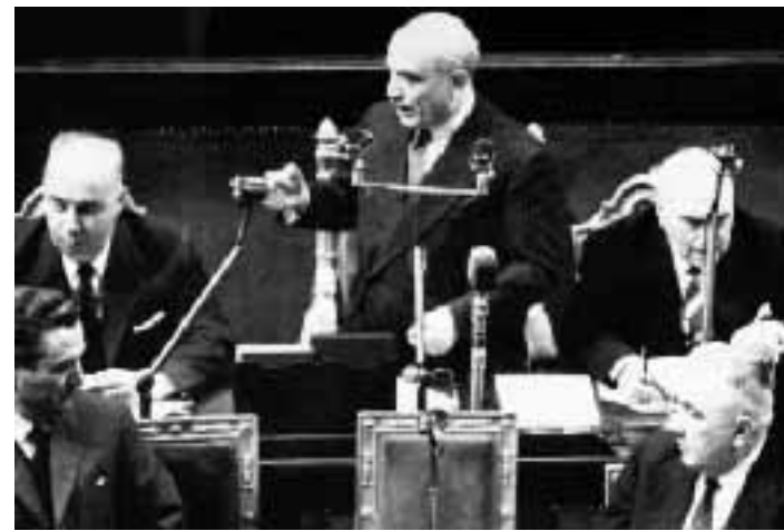
Il presidente del Consiglio Fanfani durante il suo governo nel 1962

Fu una grande stagione di riforme... «La più grande, poi, il successivo governo Moro fece molto meno. Tutto ciò accadeva in un contesto straordinario: gruppi dirigenti vicinissimi sia nel Psi che nel Pci che nella Dc. A Mosca c'era Kruscev e a Washington Kennedy. In Vaticano l'indimenticabile Giovanni XXIII. Il nostro paese viveva la stagione del boom economico e fini-