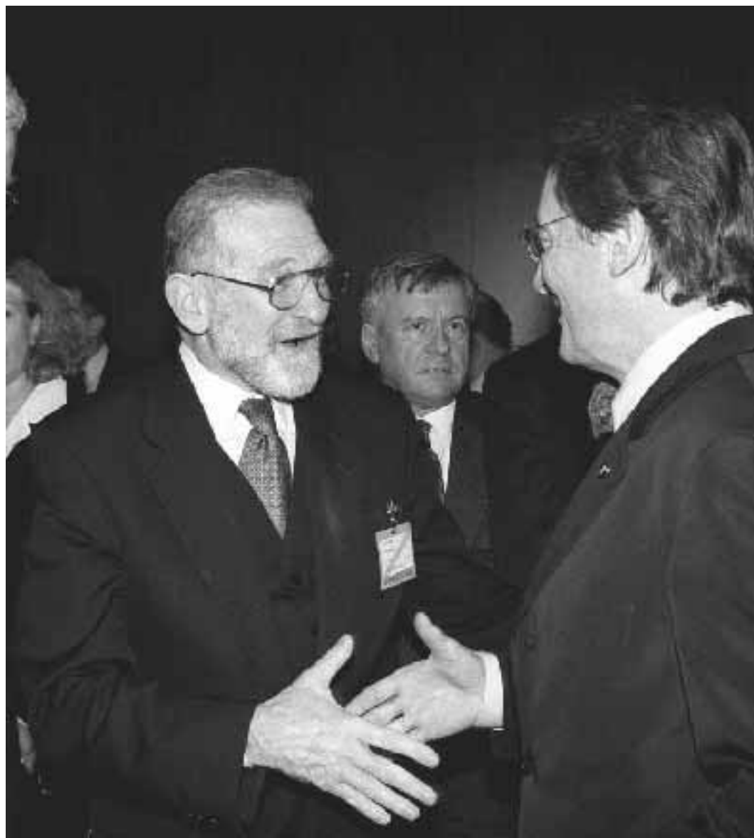
Il ministro degli Esteri austriaco Schuessel dà il benvenuto al collega polacco Geremek

«Con questi negoziati, il treno è partito, nessuno potrà fermarlo», ha detto con enfasi Schuessel. Ma tutti sanno che, a dispetto dell'ottimismo di un anno fa, il processo di allargamento, anche per una sensibile frenata impressa dal nuovo governo tedesco, procederà più lentamente. Il ministro polacco, Bronislaw Geremek, con la sua «grandissima soddisfazione» ha prenotato un posto per l'inizio del 2003, lo stesso ha fatto il ministro estone, Raul Malk. Ma, sebbene si tratti di Paesi con standard di adesione tra i più vicini a quelli dell'Unione, non è detto che la data sarà rispettata. Il traguardo potrebbe slittare anche al 2005. E