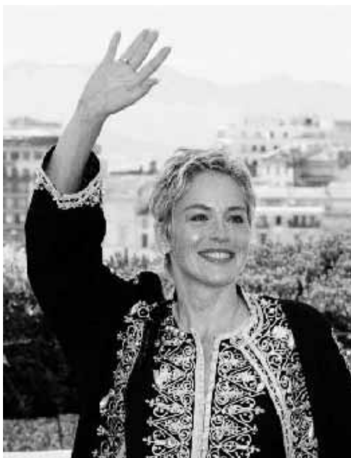
La diva dai cachet miliardari Sharon Stone