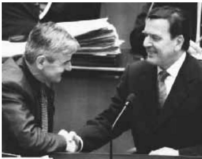
Joschka Fischer con il Cancelliere Gerhard Schröder

A parte la prudenza sull'allargamento, e un nuovo atteggiamento nella vertenza sulla rappresentanza europea nel Consiglio di sicurezza Onu (punto ieri evocato solo vagamente) va detto comunque che il nuovo cancelliere ha impostato il suo primo, e attesissimo, discorso programmatico su una linea di continuità con il governo precedente in materia di politica europea ed internazionale. Le discontinuità rispetto al centro-destra di Helmut Kohl, sottolineate con molta forza polemica con reazioni altrettanto decise da parte dei banchi dell'opposizione, hanno riguardato la politica interna, soprattutto quella economica e sociale, con il rimprovero forte rivolto a Kohl di aver fallito proprio sul terreno fondamentale dell'occupazione, nonché, se così si può dire, l'impostazione culturale di fondo della nuova campagna alla guida del paese più importante d'Europa. A cominciare dal concetto di «nuovo centro» che fu una specie di fil rouge della campagna elettorale e che Schröder ha ripreso ieri all'inizio del suo discorso, quasi a voler smentire le voci fondate e le tante chiacchiere che sono corse in Germania e per il mondo su una presunta premilenza sul governo da parte di un