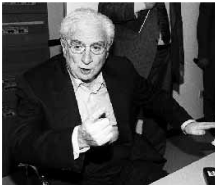
Il senatore a vita Francesco Cossiga.

E Forza Italia? «Non temiamo sgambetti da Cossiga - dice Claudio Azzolini, capogruppo a Strasburgo - al più può allungare la gamba e farmi rotolare per terra. Noi siamo tranquilli, perché contano i numeri. Intanto nel gruppo ci siamo entrati votati dal 75% dei membri, solo i rappresentanti del Lussemburgo, dell'Olanda e del Belgio, oltre, naturalmente, i popolari italiani, hanno detto no. Si vedrà a giugno come andranno le cose, perché i voti di Forza Italia saranno fondamentali