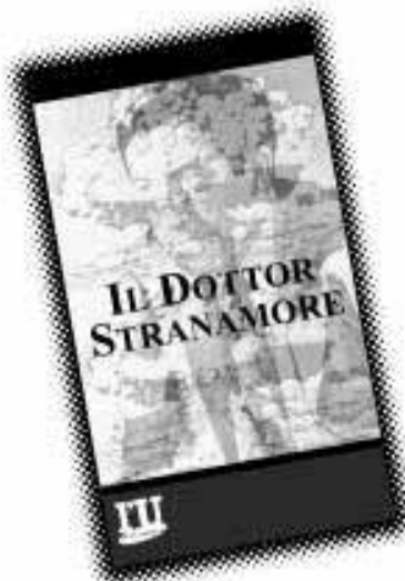
Il dottor Stranamore