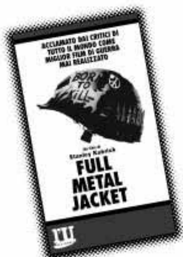
Full Metal Jacket