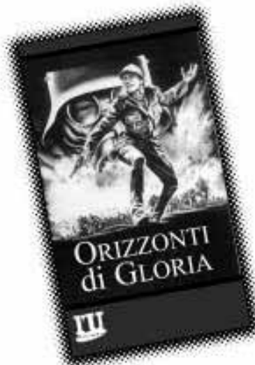
Orizzonti di gloria