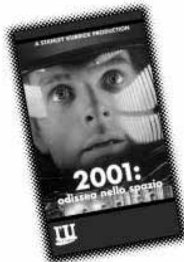
2001 odissea nello spazio