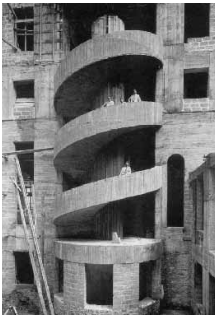
Due foto storiche: il Palazzo delle Poste e, sotto, le ex Officine Ducrot