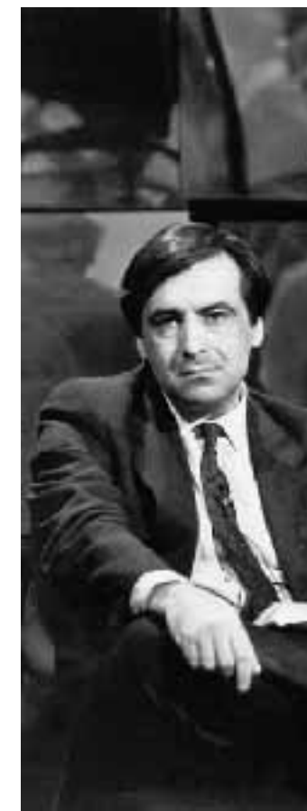
Il sindaco di Palermo Leoluca Orlando

«Palermo sta diventando una capitale mediterranea. Intanto perché è in Sicilia, una regione al centro del Mediterraneo, il mare che dopo la Guerra Fredda è tornato ad essere un mare importante. Ora il riferimento per la pace e il pretesto per la guerra non è più il comunismo e l'anticomunismo ma è drammaticamente la religione, oggi tutte le guerre si fanno in nome di un dio. Per questo il Mediterraneo torna ad essere un mare importante perché è la culla delle tre grandi religioni monoteistiche del mondo. Palermo in questo ha una grande possibilità perché ha