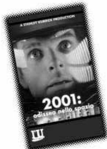
2001 odissea nello spazio