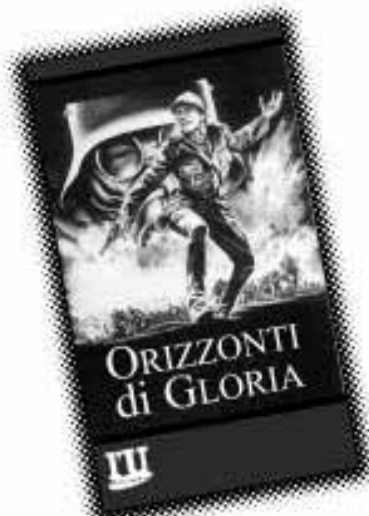
Orizzonti di gloria