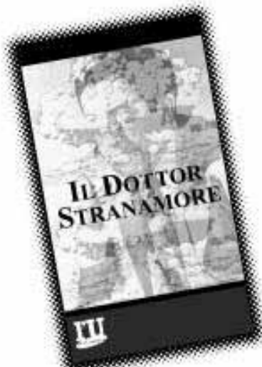
Il dottor Stranamore