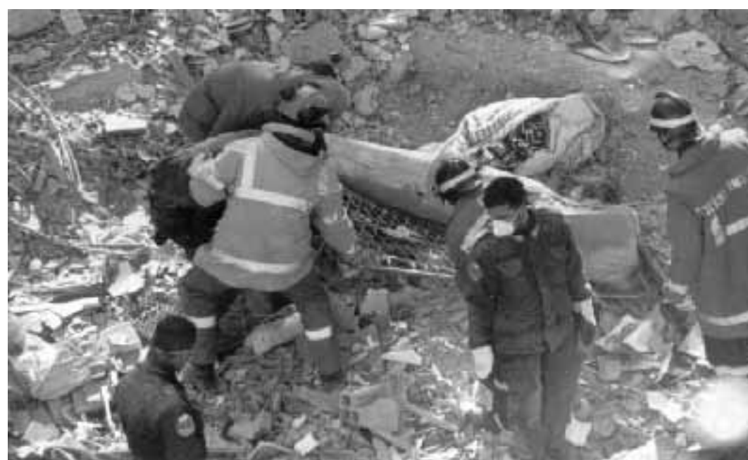
Si scava ininterrottamente per cercare le vittime

Trenta persone sotto le macerie, due coniugi tratti in salvo