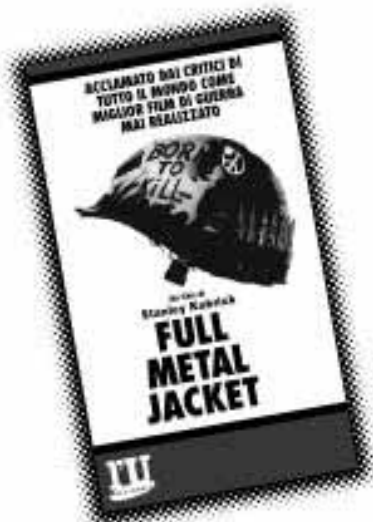
Full Metal Jacket IN EDICOLA