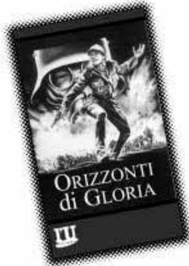
Orizzonti di gloria