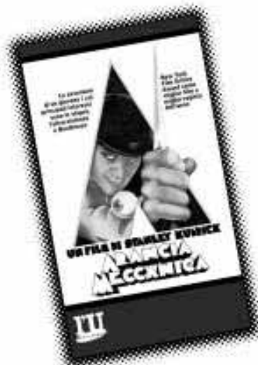
Arancia Meccanica La ristampa in edicola

Per la prima volta in edicola nove capolavori che hanno fatto la storia del cinema.