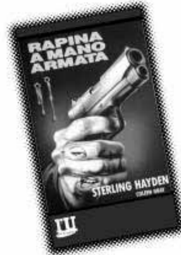
Rapina a mano armata