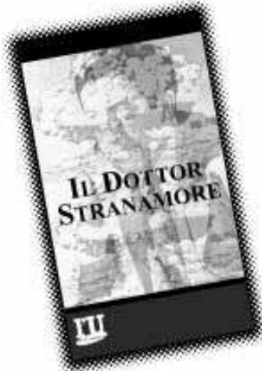
Il dottor Stranamore