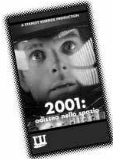
2001 odisea nello spazio