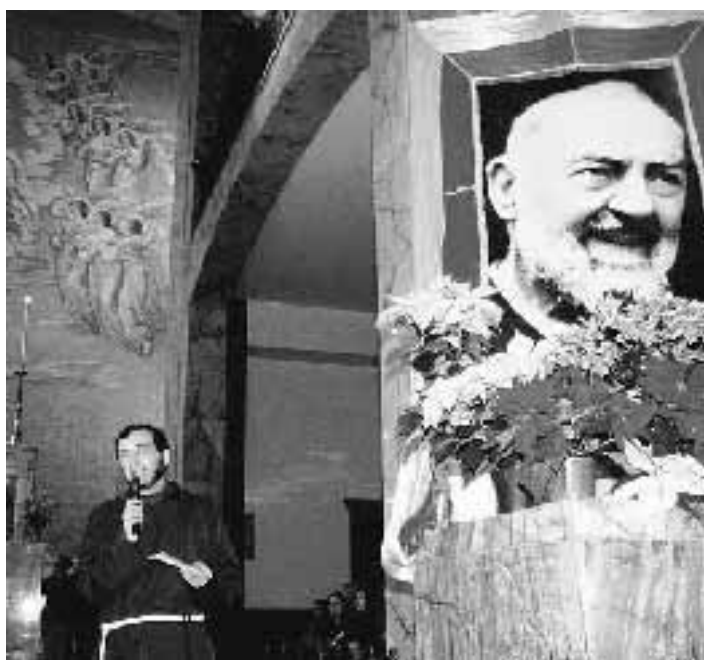
L'interno del Santuario di Padre Pio

Lo chef Gianfranco Vissani ha raccontato al mensile dell'Associazione dei Comuni, «Anci Rivista» cosa avrebbe preparato per un ipotetico pranzo tra Giovanni Paolo II e D'Alema.