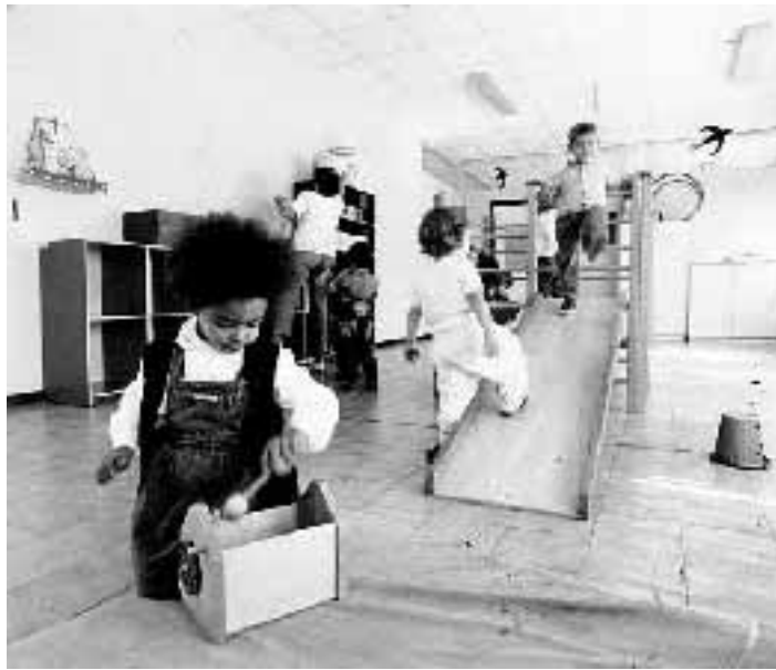
Una scuola materna, in alto l'incontro di D'Alema con il cardinale Sodano

verno a Telepace - che noi dobbiamo portare avanti la legge per la parità scolastica... perché istituisce un importante principio, il riconoscimento del ruolo sociale, quindi pubblico, svolto anche da scuole gestite da istituzioni religiose o da privati che non abbiano finalità di lucro e che rispettino alcune norme decise dal Parlamento.