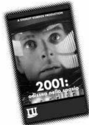
2001 odissea nello spazio