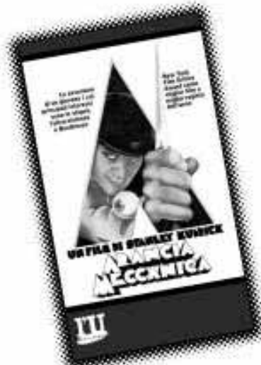
Arancia Meccanica La ristampa in edicola

Per la prima volta in edicola nove capolavori che hanno fatto la storia del cinema.