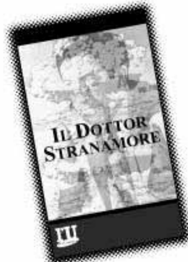
Il dottor Stranamore