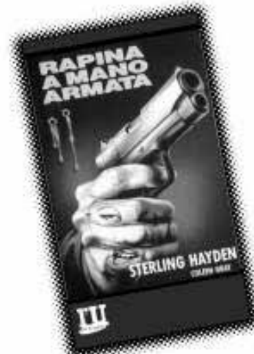
Rapina a mano armata