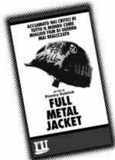
Full Metal Jacket IN EDICOLA