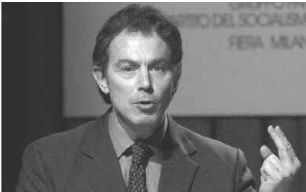
Il Premier britannico e capo dei laburisti Tony Blair

Ripartono gli applausi. Molti. Gli altri leader gli si fanno incontro per stringergli la mano. Scharping dopo un poco prova a dare la parola al premier socialista ceco, Milos Zeman, ma deve rinunciare. Altri applausi, altre strette di mano, sul palco e in sala. Poi Blair esce, seguito dalla scorta. Nella hall appare Oskar Lafontaine. Qualcuno gli chiede un giudizio sul discorso di Blair. Risposta: «Mi dispiace, sono arrivato tardi».