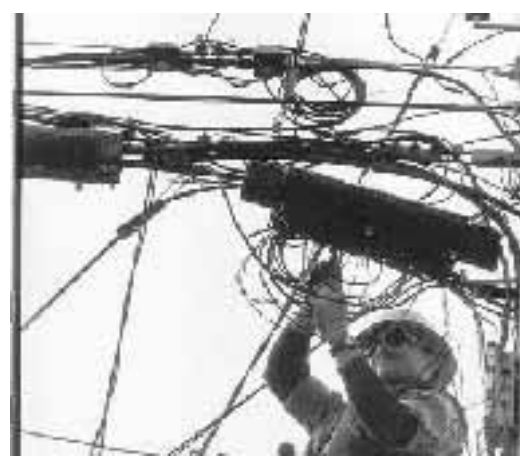
Un operaio al lavoro su un traliccio