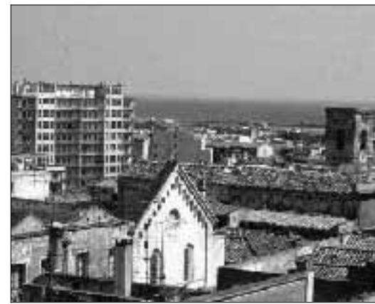
Una veduta della città di Cagliari e in alto Renzo Imbeni

candidati e dirigenti sono stati scelti lontano dall'isola. Berlusconi alla fine ha deciso che dovrà essere presidente della Sardegna, se dovesse vincere il Polo, il sindaco di Iglesias, Mauro Pili, giovanotto intraprendente, mossi sul mercato della politica sarda da tempo, già presente, chissà con quali speranze, agli Stati generali della Quercia a Firenze. «Anche questa volta - os-