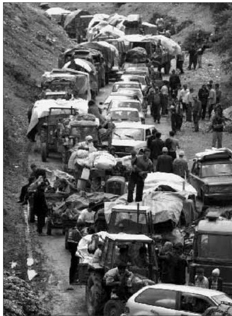
Una lunga fila di profughi mentre rientrano in Kosovo

«Sono ottantamila i serbi fuggiti dal Kosovo da quando l'esercito jugoslavo ha cominciato a ritirarsi. Lo ha reso noto ieri un alto funzionario del Pds (Partito democratico serbo, moderato, di Vojislav Kustunica). Il funzionario del Pds ha precisato che «non c'è più un solo serbo in gran parte delle regioni occidentali e sud-occidentali del Kosovo».