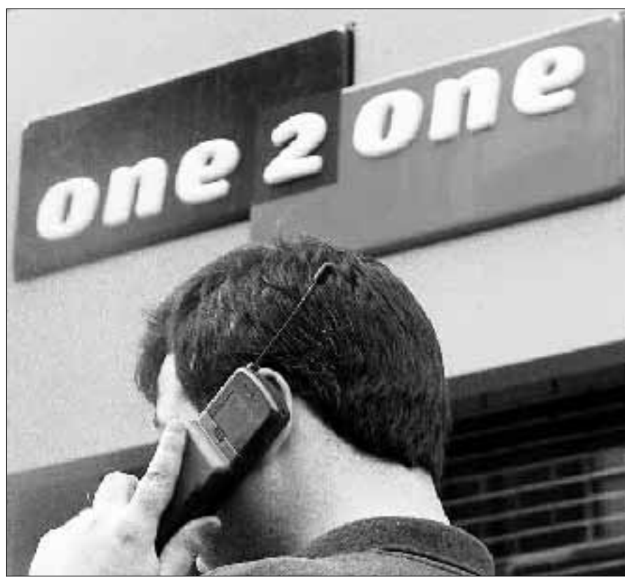
Un negozio «One 2 One» a Londra

Ieri giornata «calda» per le aggregazioni Tlc, l'inglese One 2 One acquisita da Dt