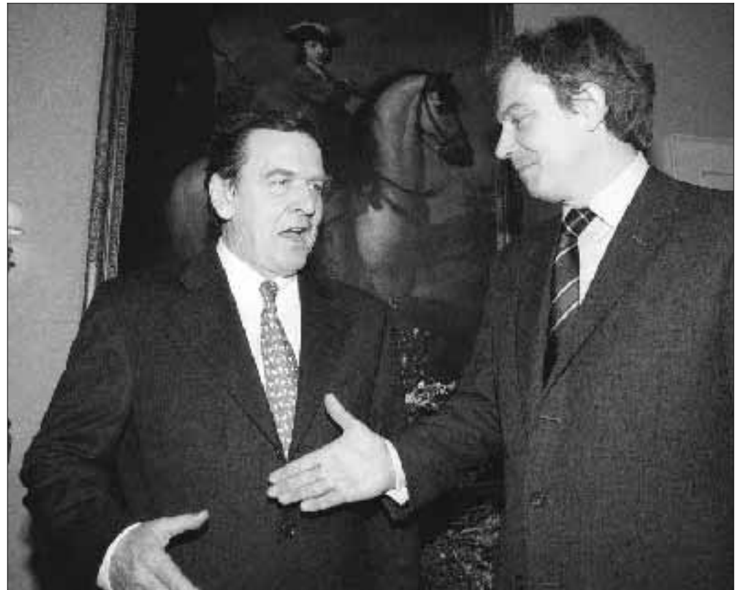
Un incontro tra il premier inglese Tony Blair e il cancelliere tedesco Gerhard Schröder.

Il documento Blair-Schröder sul Welfare State ribadisce che alcuni valori non verranno mai sacrificati (equità, giustizia sociale, libertà) mal'impianto sprigiona un pragmatismo che sembra togliere ogni slancio per una battaglia che dovrebbe appassionare milioni di persone, di giovani soprattutto. «Temo che questo documento sia nato debole e zoppo, anche se riconosco il merito di aver sollevato questioni essenziali. A mio avviso manca una critica dell'esistente in nome di qualcosa che, forse, non riusciamo ancora a definire ma che deve valere come un ideale alternativo. Un tempo era facile