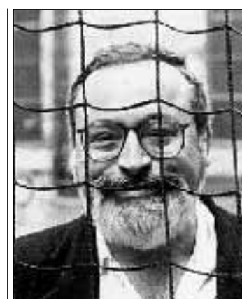
Oggi da Laterza incontro con l'autore

L'ultimo libro dello spagnolo Fernando Savater si intitola «Le domande della vita» (pap. 268, lire 25.000, Laterza editore). Un testo scritto per combattere quelle pratiche filosofiche che vogliono tenere a distanza i profani, coltivando invece il dialogo tra specialisti. Sarà dunque un'occasione per mettere in campo la filosofia e il «come» farne strumento di conoscenza, la discussione di questa mattina, organizzata dalla casa editrice Laterza, alle 11,30, alla Loggetta in via di Villa Sacchetti, 17, a Roma. Insieme a Savater discuteranno sul tema «Nuovi modi di insegnare la filosofia», Luigi Berlinguer, Tullio De Mauro e Salvatore Veca.