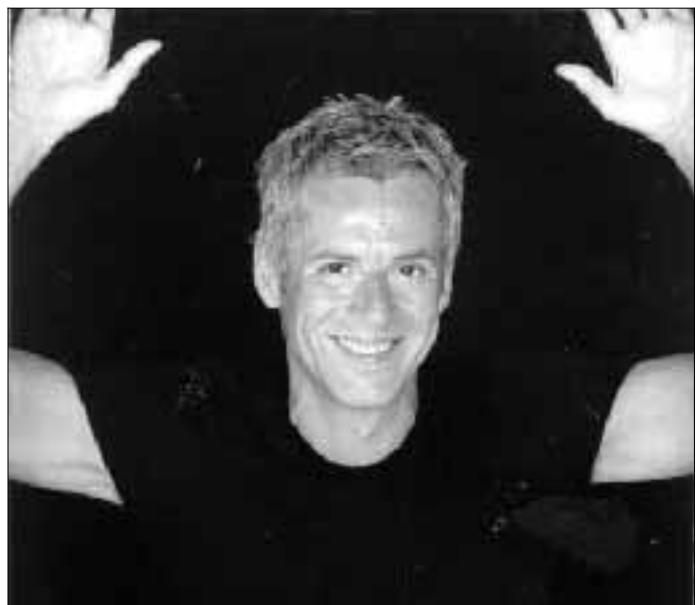
Claudio Baglioni; il 12 novembre esce il suo nuovo album

Viaggiatore è dunque un concept-album, ma è anche il bilancio, a 48 anni, di un musicista polarissimo, amato, criticato, «sdoganato», che cerca però di non «sedersi», come tanti suoi colleghi, sul successo. Anzi, qui non c'è traccia, malgrado tanta melodia e una voce in piena forma, del «piccolo grande amore» nazionale-popolare. Queste sono, per scelta, per controtendenza e anche per sfidare se stesso, «canzoni che non si possono canticchiare facilmente - spiega lui -. Ho voluto che lo fossero, perché la musica è diventata ormai una specie di karaoke, in tv come ai concerti. E mi piacerebbe che questa scelta fosse da stimolo