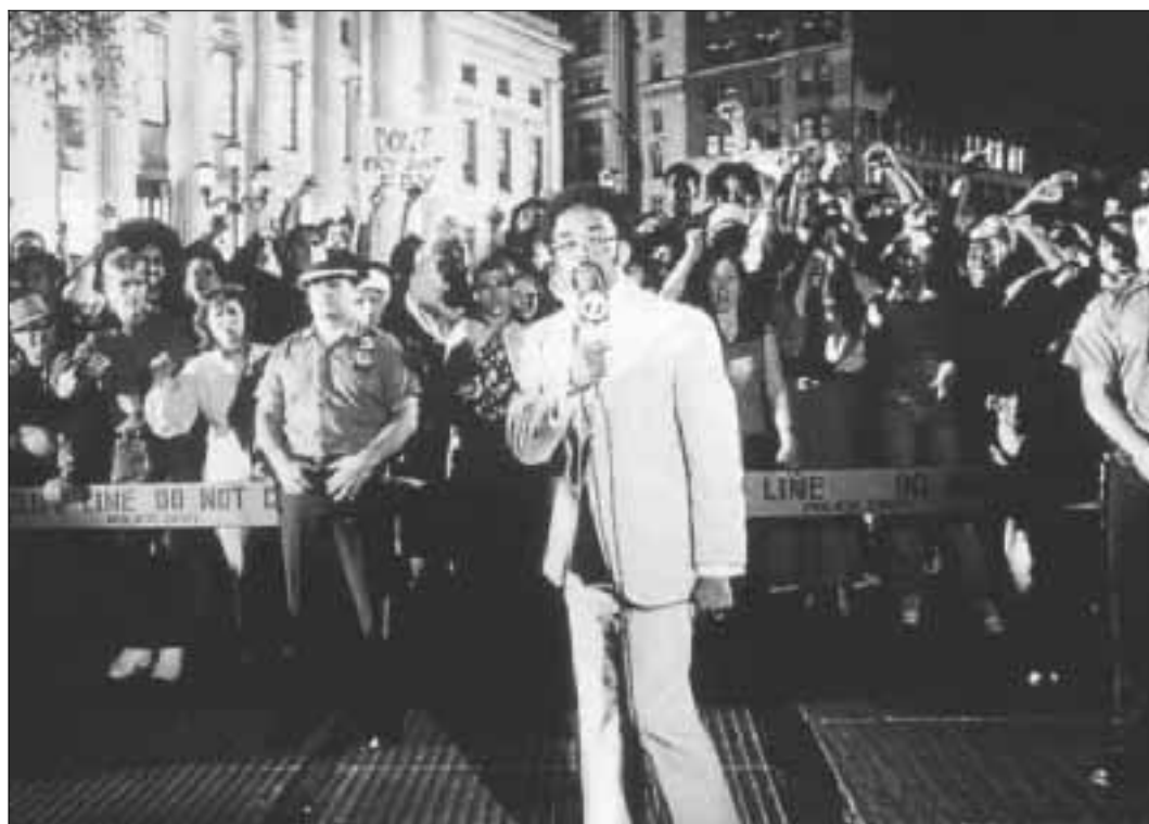
Spike Lee nei panni di un giornalista nel suo «L'estate di Sam»

«Sì, ma le abbiamo tagliate volontariamente per evitare il divieto. Ufficialmente il problema per la Mpa che assegna i rating è il sesso e la violenza, ma in realtà è solo il sesso a spaventarli. E questo non è mica un film Disney... anzi, lo è».