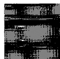
Forno elettrico a convezione con termostato