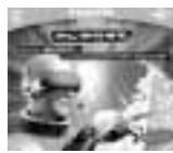
Omnia 2000 Gold De Agostini 4 cd rom Windows 95/98 lire 199.000