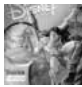
Tarzan Action game Disney Window 95/98