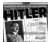
Hitler Giunti Multimedia Windows e Mac