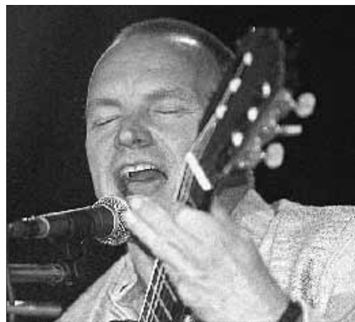
Da destra verso sinistra, nell'ordine: Sting, la band dei Rage Against the Machine, e il cantautore Ben Harper

gnà, 28 a Treviso) e Subsonica (il 22 a Marghera, il 27 a Prato, il 28 a Porto S. Elpidio). Veniamo a febbraio. Altri fuochi d'artificio. Si parte con i Bush , la più «americana» delle rock band inglesi di ultima generazione; il 12 febbraio sono al Vox di Nonantola, il 14 febbraio al Palacisalfa di Roma, il 15 all'Alcatraz di Milano. Ma l'attesa più grande è forse per i californiani Rage Against the Machine , la cui reputazione