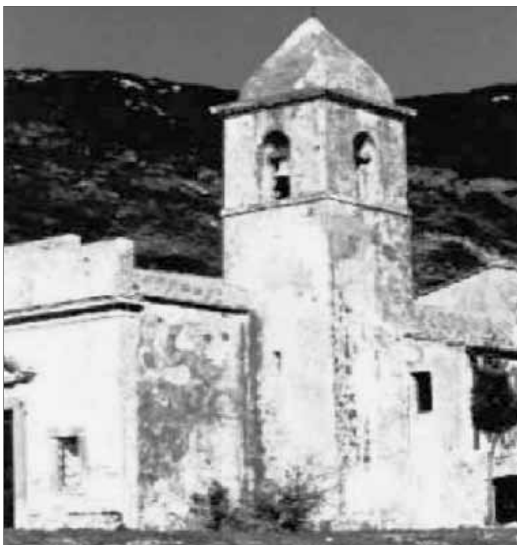
L'antica chiesa di Santa Caterina nel Comune di Rio nell'Elba

Ugualmente ci stiamo muovendo nel campo del recupero del patrimonio archeologico e culturale, nonché delle nostre tradizioni più quotidiane e popolari, ma degne di nota e di memoria, attraverso una serie di operazioni che coinvolgono il più possibile il territorio e gli uomini e le donne che ne fanno parte attiva. Ma come redigere un bilancio, per certi versi arido elenco di cifre, che comunque devono tornare uguali in entrata ed in uscita, tenendo conto che le entrate sono minime e le uscite, dettate dalla voglia di fare e di cambiare, sono enormi? Oltretutto questo è il