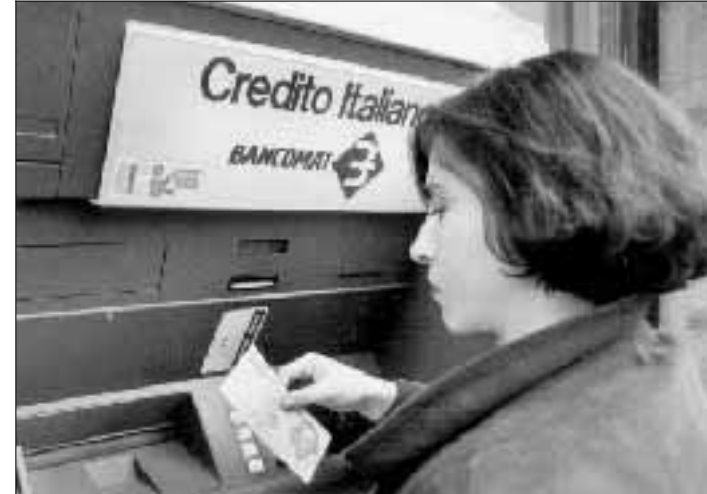
Una donna che usa il Bancomat per pagare un conto.

Intanto sono sempre meno gli italiani che pagano cash e sono sempre più diffuse tutte le altre forme di pagamento più moderne come il Pagobancomat e il pagamento delle bollette con l'addebito preautorizzato. Ormai in Italia una famiglia su due possiede la carta Bancomat, mentre una su quattro preferisce usare la carta di credito. Anche lo stipendio viene percepito, nella maggior parte