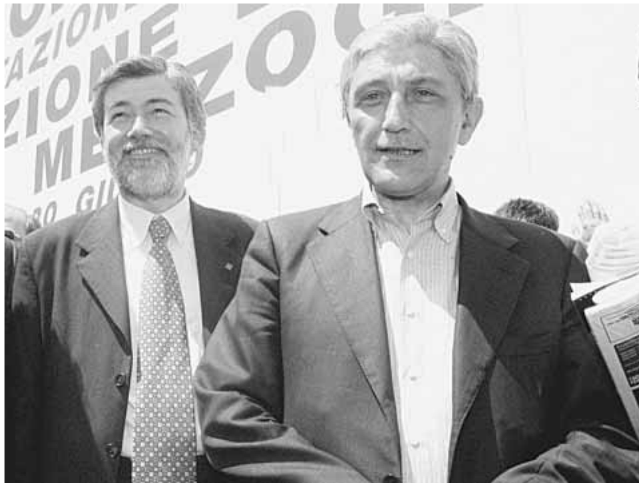
Il Governatore della Campania Antonio Bassolino con il leader della Cgil Sergio Cofferati.

La trama pregressuale dei ds si sta dunque componendo. Massimo D'Alema, presidente del partito, ha annunciato formalmente che non firmerà alcuna mozione (anche se non ha fatto certo mistero della sua preferenza per Piero Fassino come candidato alla segreteria). Sul campo congressuale si profilano la mozione dei «liberal» di Enrico Morando e Claudio Petruccioli, quella del «correntone» e quella che fa capo a Piero Fassino. Saranno formalizzate all'inizio di settembre, quando avrà fine la