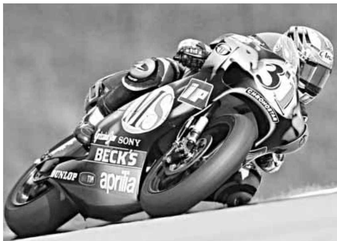
Il giapponese Tetsuya Harada sarà in pole position nelle 250 cc con la sua Aprilia, davanti a Katoh (Honda)

In attesa di ricevere la cittadinanza onoraria della cittadina di Auduere martedì prossimo, quan-