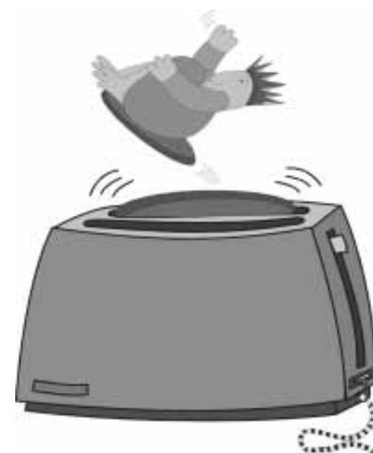
Sapete come si fa a lavarsi le mani con un TOSTAPANE? Basta....