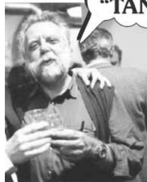
E'... quello nella foto. Autore di satira, ma anche, come dice lui stesso, direttore del mitico inserto satirico dell'Unità "Tango". Anagrammate le sue parole (IO RESSI TANGO) per ottenerne il nome e cognome.