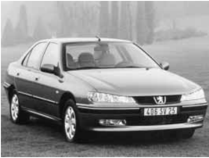
La Peugeot 406 berlina (versione SV) ha un ottimo motore 1800 da 116 CV

Insomma la signora 406, con i suoi 430 litri di capienza dei bagagli (berlina) e i 526 (fino a 1741) della station wagon, ha mostrato di avere ancora i connotati giusti per stupire, confermando la validità di un progetto solo in parte criticabile per quel che riguarda il design, forse troppo convenzionale. Altri modelli della Casa del leone, ovvero 206 e 307, hanno