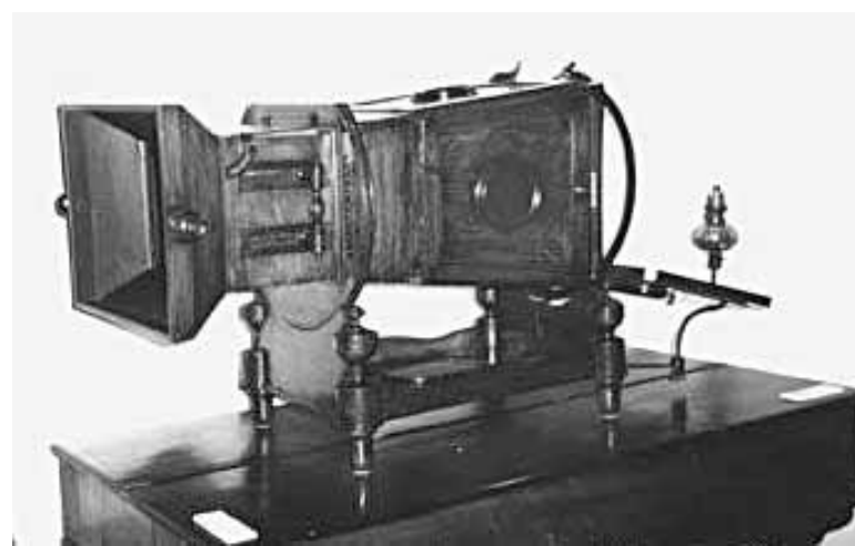
Megaleoscopio privilegiato (1864) e a sinistra una fotografia su vetro colorata a mano di una serie inglese ispirata al «Racconto di Natale» di Dickens

sione, innanzitutto. Ma anche il fatto che, come sostiene la signora Zotti, difendere dal passare del tempo questi delicati oggetti significa anche contrastarne il destino, che li vorrebbe perduti per sempre o dispersi chissà dove, nelle teche di apprensivi collezionisti. La lanterna magica è un apparecchio